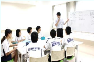
事務部長より病院での仕事についてお話がありました

ナイストライ事業(中学生の職場体験授業)が今年も行われ、9月8日、9日、10日の3日間、 植木北・北部中学校2年生7名を受け入れました。3日間で各部署の仕事を学びました。