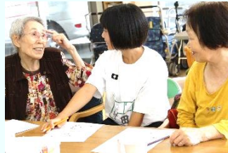
デイケアにて... 利用者さんとお話をしました