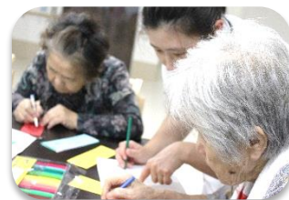
願いを込めて書きます