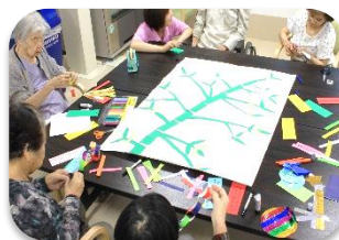
一生懸命作りしました