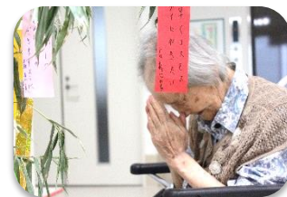
願いが叶いますように