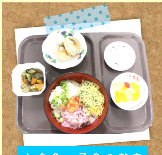
七夕食・昼食の献立