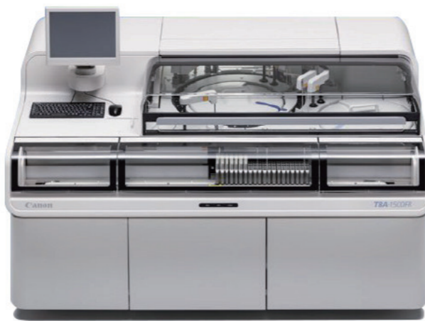
参照 Canon HP

これからも、精度保証に努め、なお一層地域の皆様の健康の増進に寄与できますよう、最新の知識と技術を身につけ、日々努力を重ねて参ります。